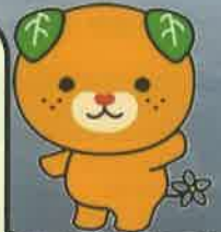
愛媛県イメージアップキャラクター みきゃん

※地域おこし協力隊は、都市住民など地域外の人材を地域社会の新たな担い手として受け入れ、地域力の維持・強化を図るものです。（詳しくは総務省ホームページをご覧ください。）